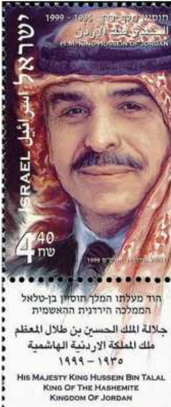
طابع بريد أصدرته هيئة البريد الإسرائيلية عند وفاة الملك الحسين بن طلال ويحمل اسمه وصورته